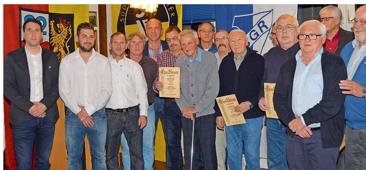
Die Ehrennadeln und Geehrten der Spielgemeinschaft Rieschweiler.